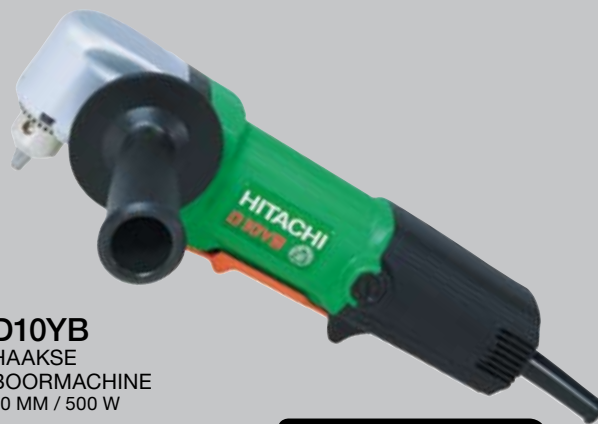
D10YB HAAKSE BOORMACHINE 10 MM / 500 W

BUITENGEWOON LAGE CONSTRUCTIEHOOGTE: 83 MM.