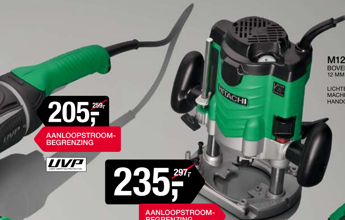
M12VE BOVENFREESMACHINE 12 MM / 2.000 W

LICHTE MAAR ZEER KRACHTIGE MACHINE MET INSTELBARE HANDGREPEN.