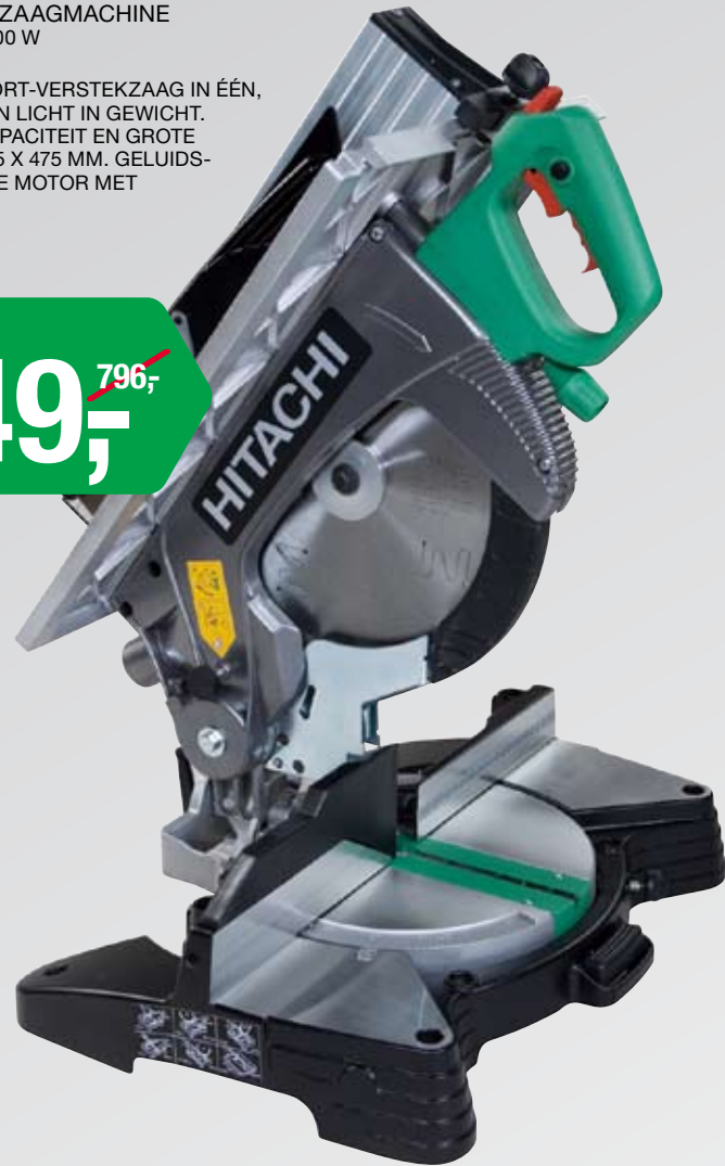
C10FSH AFKORT-VERSTEKZAAGMACHINE BLAD 235 - 255 MM Ø / 1.090 W

BREDE AANSLAG VOOR STABIELER WERKEN. MET LASER OM ZEER NAUWKEURIG EN SNEL DE ZAAGSNEDE TE BEPALEN. ZAAGCAPACITEIT 85 X 312 MM.