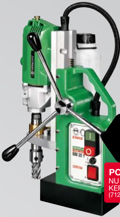
BM20Y MAGNEETVOETBOOR- MACHINE 30 MM / 720 W

AUTOMATISCHE SNIJ- VLOEISTOF TOEVOER. ZEER VEILIGE MAGNEETVOET. IN KOFFER.