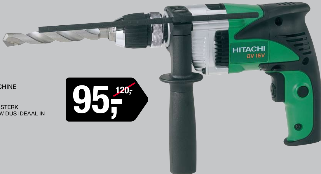
DV16V KLOP-BOOR-SCHROEFMACHINE 16 MM / 590 W

LICHTGEWICHT MACHINE MET STERK ALUMINIUM HUIS. KORTE BOUW DUS IDEAAL IN KRAPPE RUIIMTES. IN KOFFER.