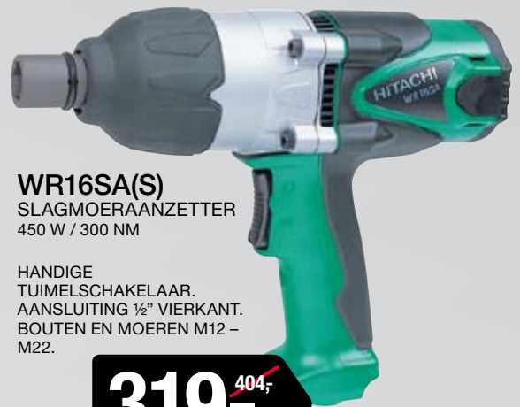
WR16SA(S) SLAGMOERAANZETTER 450 W / 300 NM

AAN/UIT SCHAKELAAR MET VARIABLELE SNELHEID, AANLOOPSTROOMBEGRENZING EN GROTE BUMPER. VOOR MIXERSTAVEN 120/160 MM Ø. COMPLEET MET GARDE.