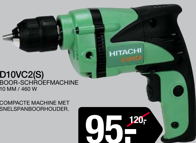
D10VC2(S) BOOR-SCHROEFMACHINE 10 MM / 460 W

COMPACTE MACHINE MET SNELSPANBOORHOUDER.