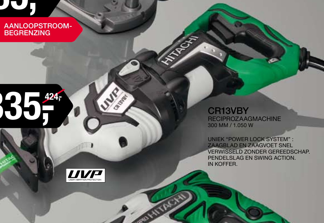
CR13VBY RECIPROZAAGMACHINE 300 MM / 1.050 W

UNIEK "POWER LOCK SYSTEM" : ZAAGBLAD EN ZAAGVOET SNEL VERWISSELD ZONDER GEREEDSCHAP. PENDELSLAG EN SWING ACTION. IN KOFFER.