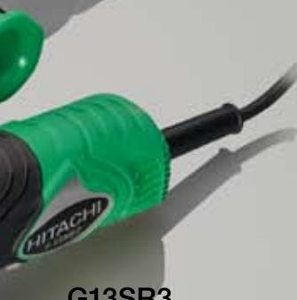
G13SR3 HAAKSE SLIJPMACHINE 125 MM Ø / 730 W

ZEER COMPACTE BODY EN LAAG GELUIDSNIVEAU.