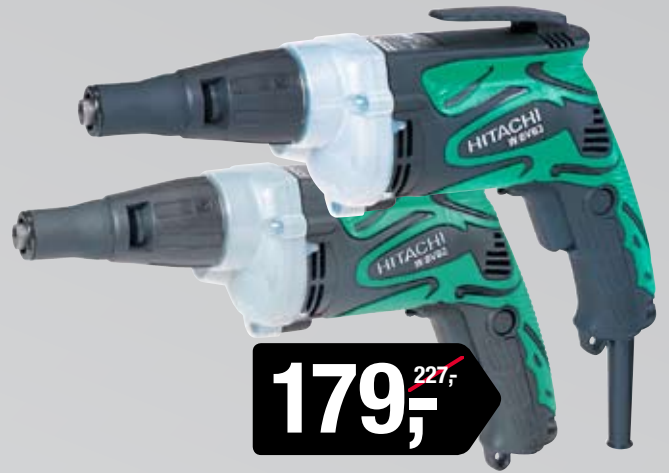
W6VB3/W8VB2 SCHROEVENDRAAIERS 6/8 MM / 620 W

NEUS ZEER SNEL DEMONTABEL DUS GEMAKKELIJK VERVANGEN VAN DE BIT. AANSLUITING 1/4" ZESKANT. ALUMINIUM TANDWIELHUIS. BESCHERMKAP TEGEN TEMPERATUURSINVLOEDEN. TRAPLOOS INSTELBAAR TOERENTAL. EXTRA LANG SNOER VAN 7,5 METER!